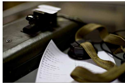
Aakkoset ja kuuloket.