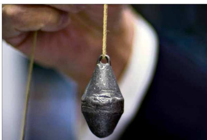
Paino, joka heitettiin puuhun yhteyden ottamista.