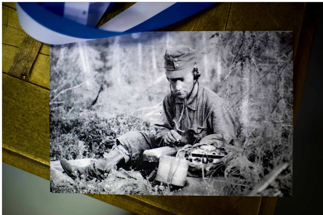
Siellä jossakin sähköttämässä kyynelradiolla tietoja vihollisesta.

Justin Timberlaken uusi albumi myy hurjaa tahtia HELSINKI Pop-tähti Justin Timberlaken uusi albumi The 20/20 Experience on myynyt maailmanlaajuisesti jo yli kaksi miljoonaa kappaletta. Levy-yhtiö Sony Musicin mukaan albumi on ollut alkuvuoden myydyin levy maailmassa. The 20/20 Experience on parhailaan kolmatta viikkoa albumimyynnin listaykköosena Yhdysvalloissa, Britanniassa ja Kanadassa. Julkaisuvikollaan levy nousi myös iTunes-musiikkipalvelun nopeimmin myyväksi albumiksi koko palvelun historiassa.